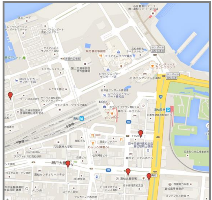
JR 高松駅周辺コインパーキング